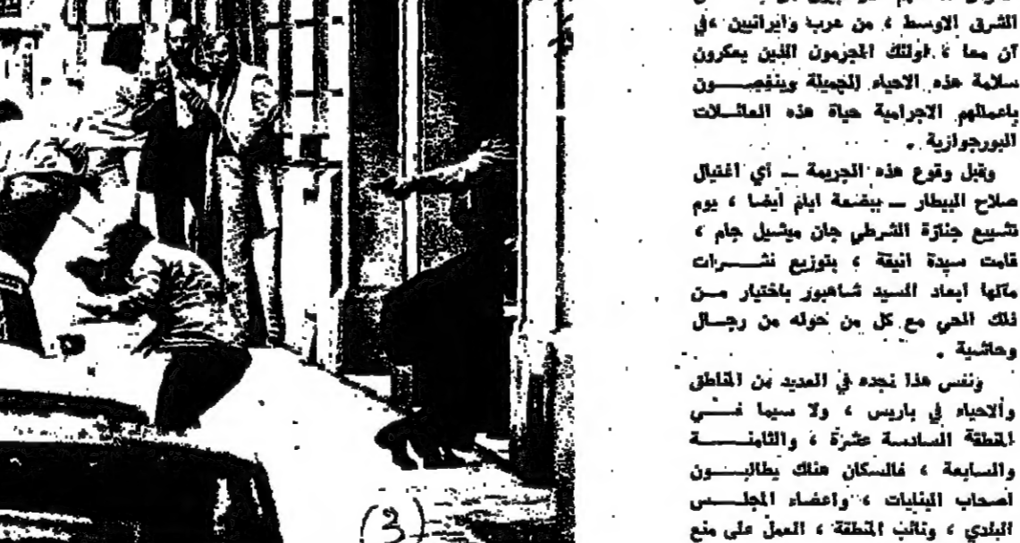
الحوادث التي تلت

الحوادث التي تلت هذه الافتقالات بشاعر الشعب في مناسبات عديدة ، وكانت اخرها يوم اغتالوا صلاح البيطار بطريق رصاصة في شقته ، وهو يقع باب مكتبه في شقته في الطابق الثامن .